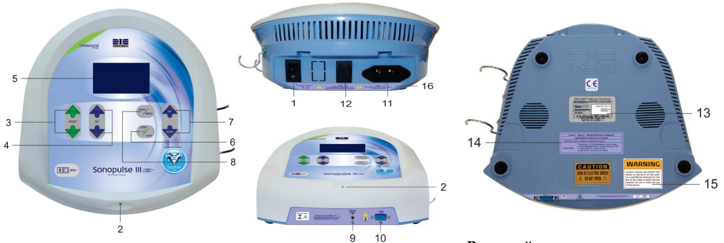
Внешний вид аппарата